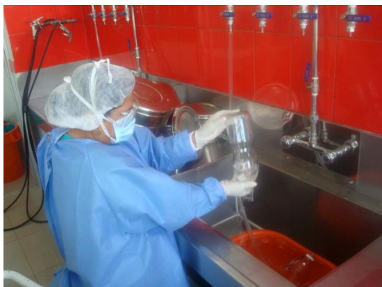
Roja (1ra. Etapa)