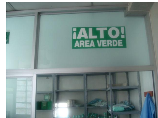
Verde (3ra. Etapa)